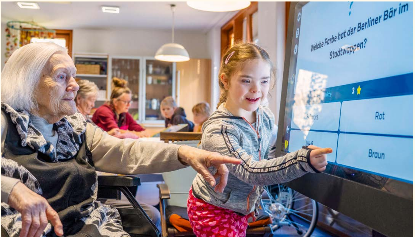
Welche Farbe hat der Berliner Bär? Gemeinsam findet sich meist schnell eine Antwort.