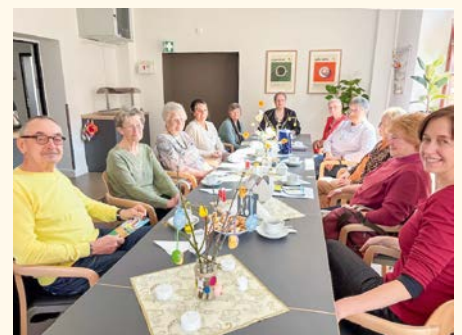
Dem Seniorenbeirat gefiel es.

Die Mitglieder der Seniorenvertretung Halle e.V. sind immer interessiert an neuen Angeboten für die älteren Hallenserinnen und Hallenser.