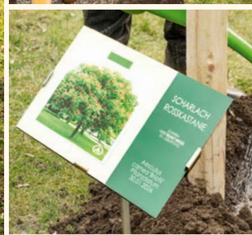
Für Gertrude Albrecht (sitzend) kam eine Gefülltblühende Vogelkirsche in die Erde. Helmut Weigel (links auf Bild rechts oben) wünschte sich eine Rosskastanie.