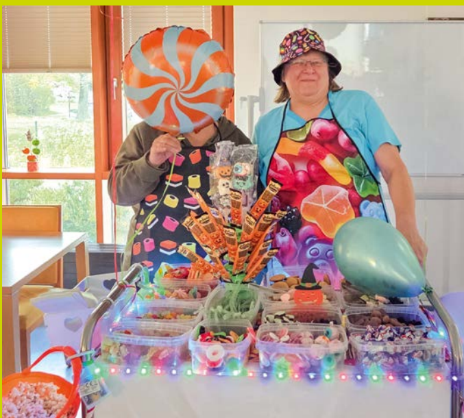
So bunt und süß zog die Bar durchs Haus.

Aus einem einfachen Servierwagen machten sie kurzerhand eine bunte Candy-Bar. Mit dem Wagen voller Süßigkeiten gingen sie durchs Haus und klopfen an viele Zimmertüren. Für die Bewohnerinnen und Bewohner gab es kleine Leckereien, die nicht nur den Gaumen, sondern auch die Stimmung aufhellten. Eine liebevolle Idee, die für viele kleine Genussmomente und ein Lächeln gesorgt hat. ∞